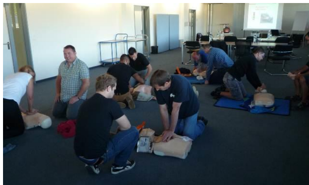
Corso di aggiornamento di pronto soccorso 2015