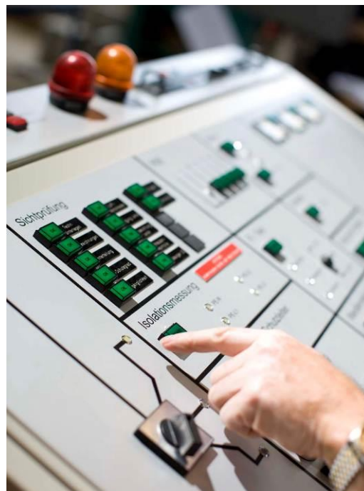
Pannello per la verifica di distribuzioni a BT