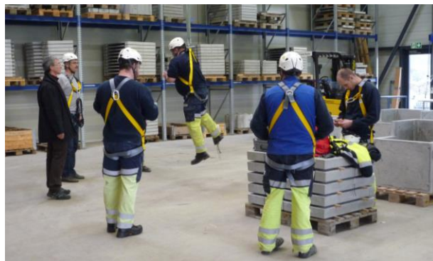
Corso di prevenzione DPI contro le cadute 2014