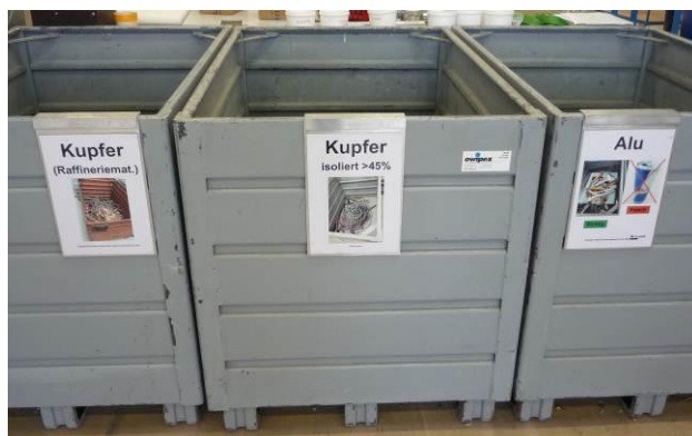
Esempio di raccolta differenziata